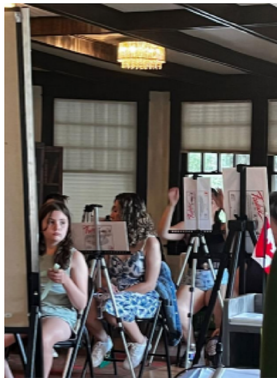
Taller de pintura surrealista “Diversidad e inclusión, Calgary, Canadá