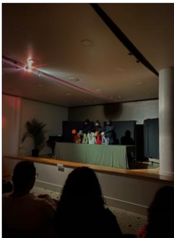
Espectáculo marionetas “Sin Camino”, Paris, Francia