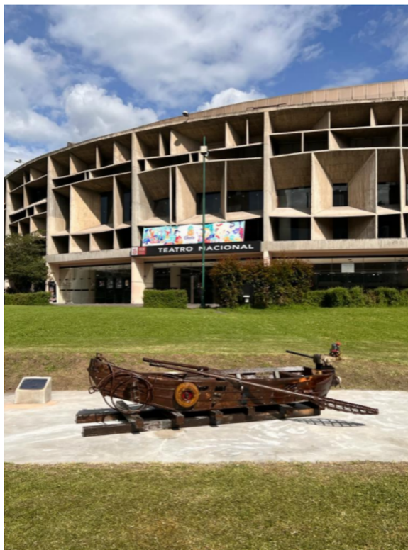
“Memoria Viva” Quito, Ecuador